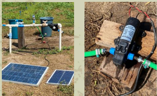
Figura 13. Instalação de fertirrigação com bomba injetora acionada por energia solar