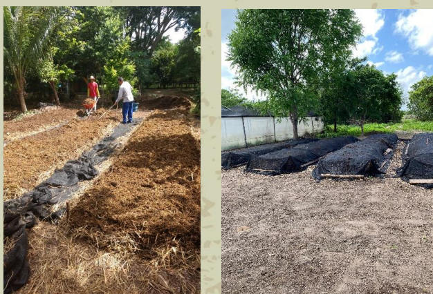
Figura 7. Preparo de composto orgânico, com utilização de esterco bovino e palhadas de adubos verdes, para adubação de fundação e cobertura.

Para cultivo sob sistema orgânico das aceroleiras, aplicar mensalmente por planta, até o segundo ano, 300 g de torta de mamona (5% N), 20 g de sulfato de potássio e 3,0 kg de composto orgânico. Depois do segundo ano, aplicar, mensalmente, por planta, 500 g de torta de mamona, 36 g de sulfato de potássio e 5,0 kg de composto orgânico (Figura 7).