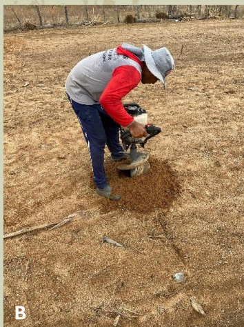
Figura 4. Abertura de cova para plantio por tubete (A) e por muda de sacola (B).

Para cultivo sob sistema orgânico, fazer a adubação de fundação nas covas com 500 g de fostato natural e 20 L de esterco de curral curtido ou composto orgânico. No caso de não ter sido feita a calagem inicial, acrescentar 250 g de calcário dolomítico por cova.