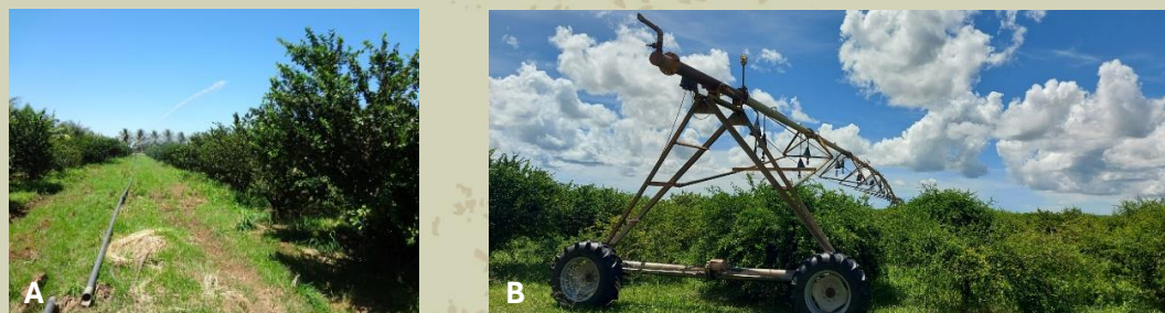
Figura 11. Irrigação por aspersão convencional (A) e por pivô central (B) em aceroleira.

Também podem ser utilizados os sistemas por aspersão convencional e o pivô central (Figura 11).