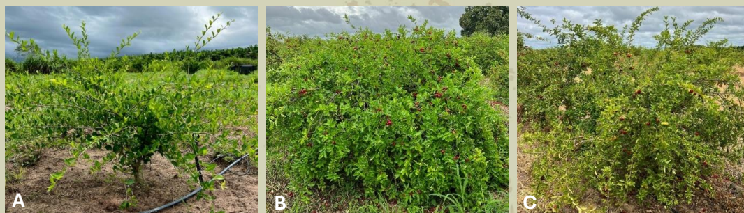
Figura 2. Plantas das cultivares BRS Jaburu (A), Junko (B) e BRS Apodi (C).