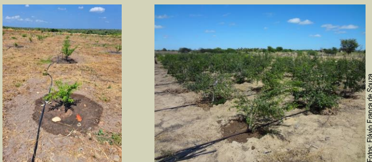
Figura 10. Linha lateral de irrigação por fileira de plantio com um microaspersor por planta.

Nessas condições o sistema de irrigação localizada é o mais indicado, podendo ser o gotejamento para plantios mais adensados e a microaspersão para espaçamentos maiores, com um emissor por planta, instalado a 0,30 m do tronco e com vazão de 40 a 50 L/h (Figura 10).