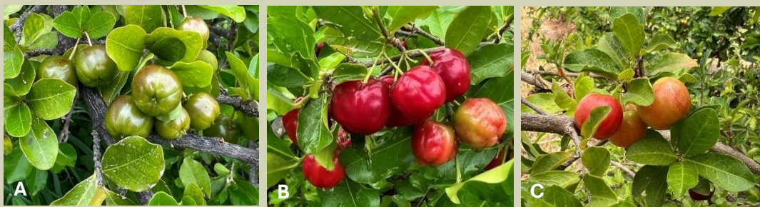
Figura 1. Frutos das cultivares BRS Jaburu (A), Junko (B) e BRS Apodi (C)

As variedades de aceroleira se distinguem pela sua finalidade, podendo ser classificadas em doces, como a BRS Cabocla e BRS Rubra, ou ácidas como a BRS Apodi, BRS Jaburu, BRS Sertaneja, Junko, Flor Branca e Okinawa. As acerolas doces são colhidas maduras e destinadas ao consumo in natura, à produção de polpas e sucos. Atualmente, as acerolas ácidas representam a principal oportunidade de negócio da fruta, pois, são colhidas verdes e processadas pelas fábricas de extração de vitamina C. Nesse caso, as cultivares Junko, BRS Apodi (Clone 13/2) e BRS Jaburu (Clone AC 69) têm se destacado pela produtividade e qualidade dos frutos. (Figuras 1 e 2).